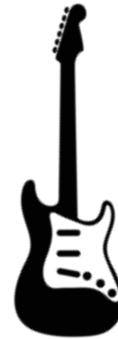
Chitarra 2 + amp chitarra