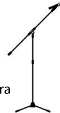
Cori e Chitarra