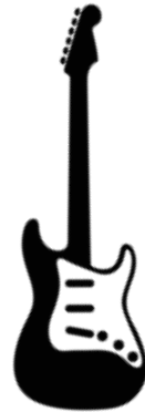
Chitarra 1 - niente amp (entra diretta nel PA)