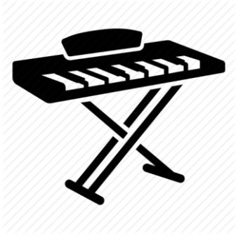
Tastiere (2 entrambe con uscita XLR)