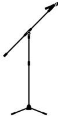
Voce principale e chitarra